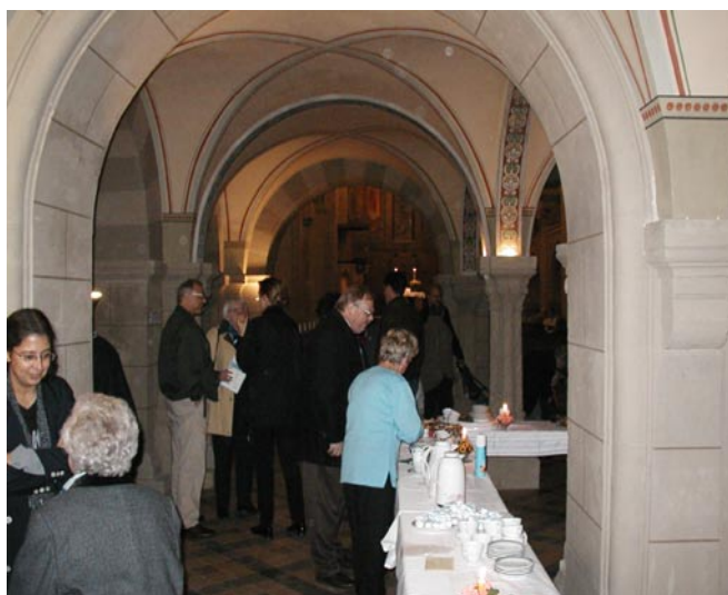
am Kuchenbuffet im Paradies

Nach tagelangen Reinigungsarbeiten in der Kirche konnten wir mit der Ausschmückung - z.B. mit Kerzen für die Sitzreihen, Blumenschmuck und der Vorbereitung des Kuchenbuffets - beginnen. Während der Vorbereitung fanden trotzdem noch Besucher und ein Radioreporter vom Mitteldeutschen Rundfunk den Weg in die Klosterkirche. Auch diese Personen waren angenehm überrascht, die 14 Stuckengel in solcher Pracht vorzufinden.